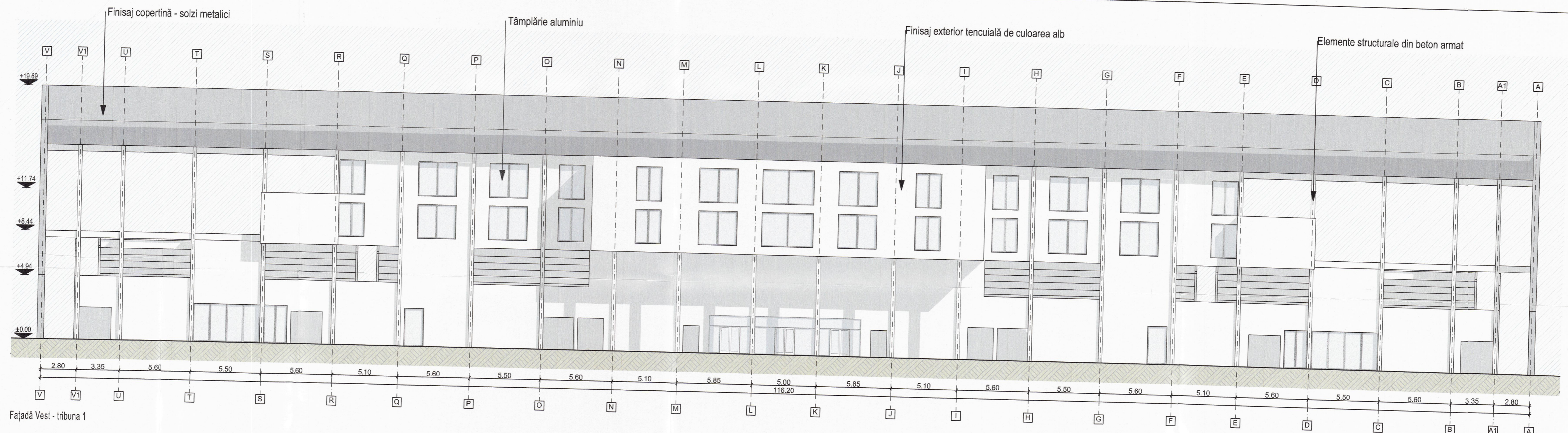
Fațadă Vest - tribuna 1