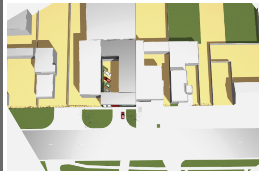
VEDERE AERIANĂ AMPLASAMENT