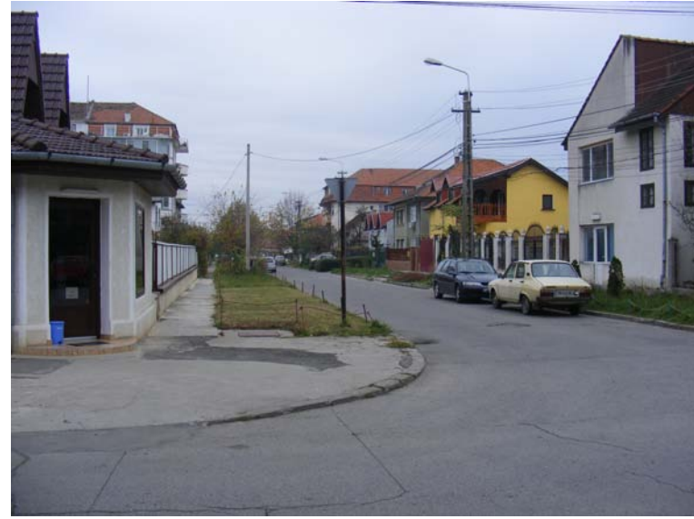
FRONT LA STRADA CARPATI