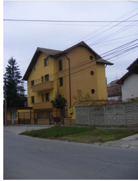
STRADA BUCEGI NR. 7